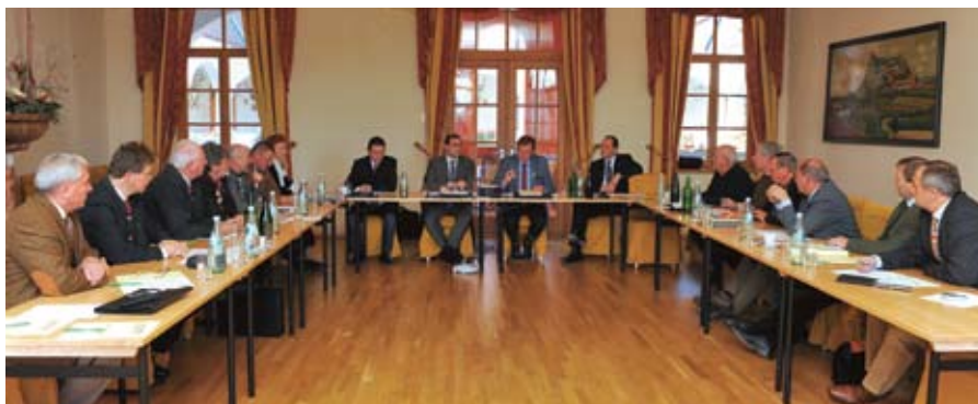
Der Landesvorstand tagte diesmal im Schloss-Weingut Thaller in Großwilfersdorf

Die nahezu explodierenden Kosten im Sozialbereich ermöglichen kaum mehr ordnungsgemäße Voranschläge der Sozialhilfeverbände. Neue Richtlinien zum Hochwasserschutz bringen für die Gemeinden in nächster Zeit kostenintensive Investitionen einerseits und eine restriktivere Siedlungspolitik andererseits. Die geplante Schließung weiterer Postämter,