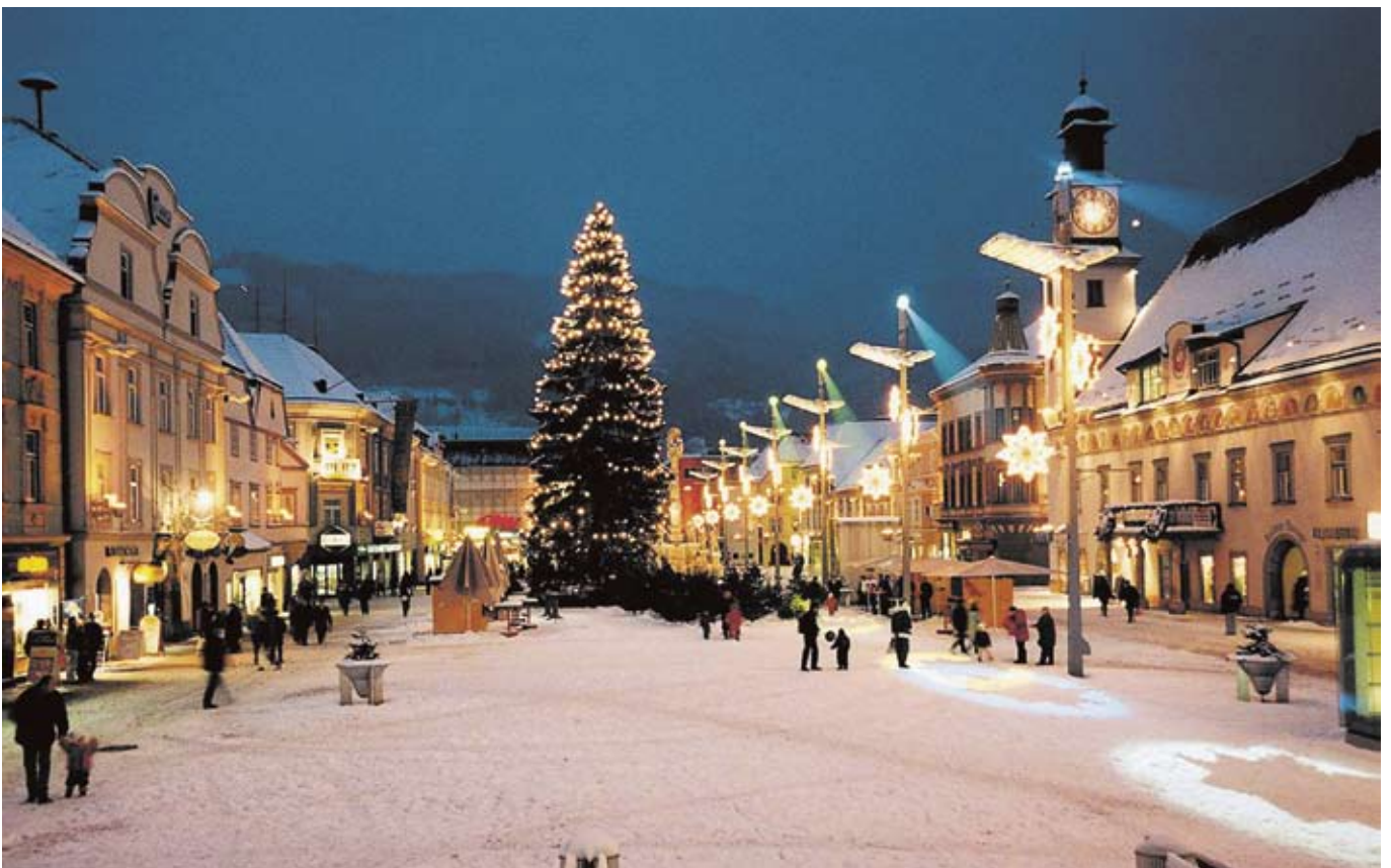
Adventstimmung am Hauptplatz von Leoben